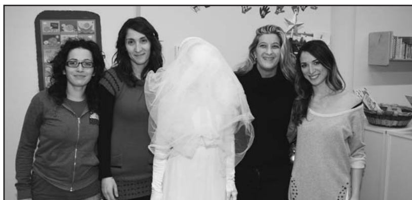
Le maestre con “Santa Lucia”.

All'asilo Hakuna Matata, presso la nuova struttura in via Badazzole, è arrivata Santa Lucia, con il volto coperto e vestita di bianco, che ha distribuito caramelle a tutti i bambini. I genitori hanno concorso alla festa portando torte di ogni tipo, bevande per un pomeriggio dove fra scatti con il cellulare e emozioni condivise con i loro figli ed i nonni con i loro nipoti, si è ripetuta la favola della Santa annunciata