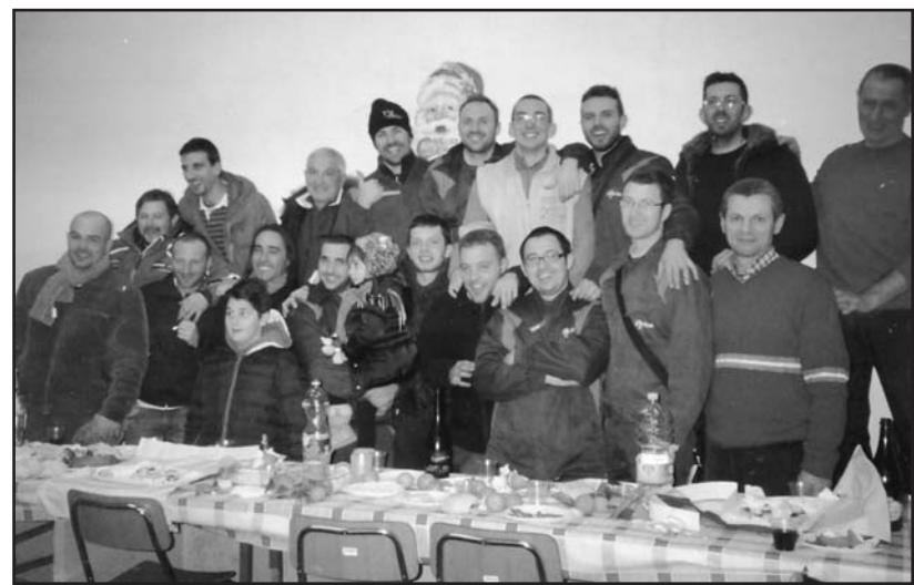
Foto ricordo per il nuovo anno 2014.

Una “merendina” in compagnia ed uno scambio di auguri per le feste natalizie e per un 2014 di lavoro, salute e serenità; da parte dei dipendenti Enel un augurio a tutta la popolazione.