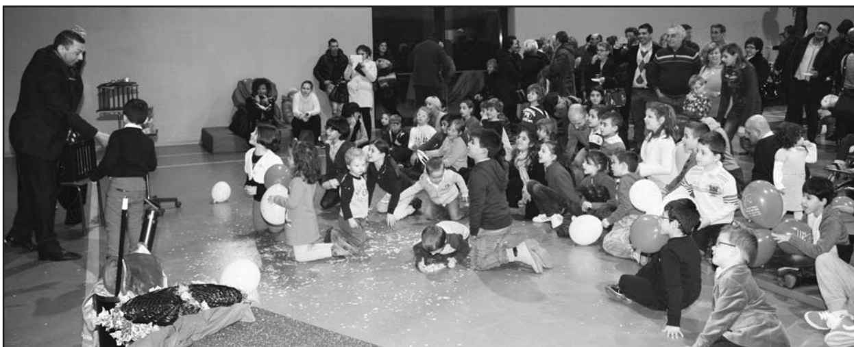
Giochi e divertimento per i bambini alla festa di fine anno.

Ancora una volta questa Onlus è riuscita ad essere soggetto aggregante e vivace portavoce di questo "difficile" mondo della disabilità infantile.