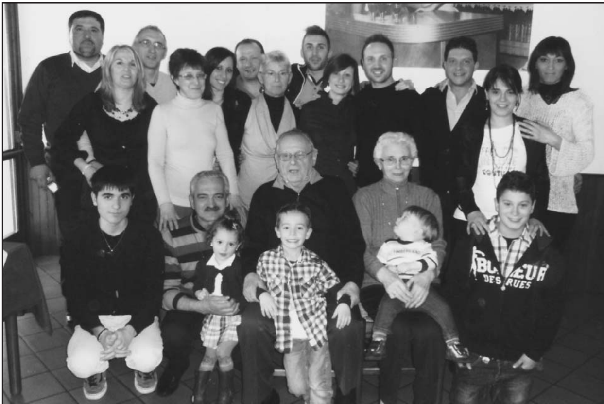
La foto ricordo dell'anniversario.