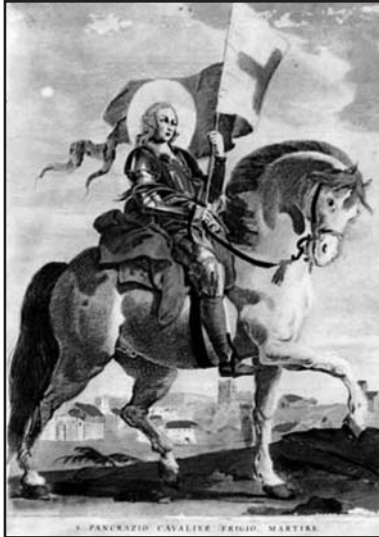
S. Pancrazio, Patrono di Montichiari.