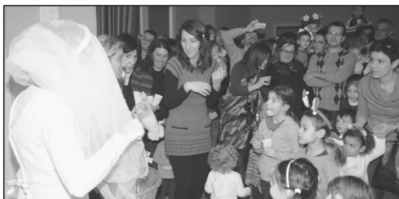
S. Lucia mentre distribuisce dolci ai bambini.