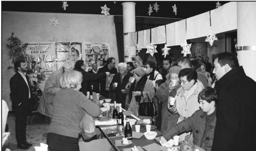
Rinfresco offerto dall'AVIS-AIDO al termine dello spettacolo organizzato dalla Banda Giovanile al Cinema Teatro Gloria in occasione delle feste natalizie.

Filo diretto con l'Avis - Non aspettare vieni a donare