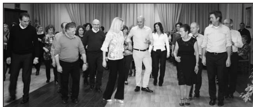
Alla serata dell'Eco si balla e ci si diverte.