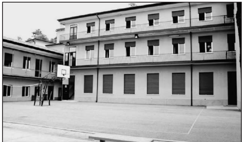
La sede della scuola Tovini - Kolbe a Montichiari.

S ono aperte le iscrizioni per l'anno scolastico 2014/2015 alla Scuola Primaria Giuseppe Tovini ed alla Scuola Secondaria di Primo grado Massimiliano Kolbe. Per maggiori informazioni, per conoscere il progetto educativo e/o per una visita guidata alla scuola, sono a dis-