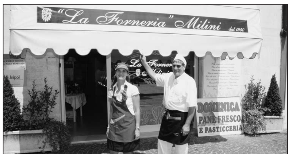
L'entrata del negozio in Piazza Treccani a Montichiari.

RINGRAZIANO LA GENTILE CLIENTELA PER LA PREFERENZA E AUGURANO A TUTTI BUON 2014